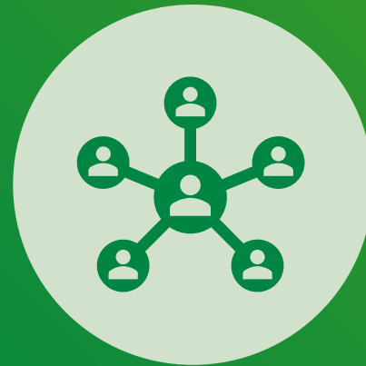
Beleidsadviseur medisch-ethische zaken